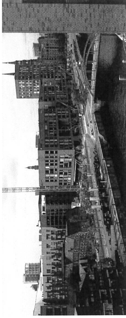
Hafen City, Hamburg

Transformasjonsområde med sosiale aspekter i Bergen. Vi vil få se den nye filmen om prosessen i Damsgårdssundet og høre litt om prosessene og utfordringene knyttet til overvannshåndtering og byggingen av Løvsstien.